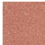
05 coccio pesto