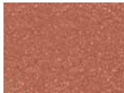
05 coccio pesto