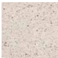
02 bianco luna