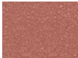
05 coccio pesto