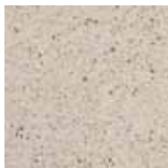
02 bianco luna