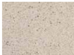
02 bianco luna