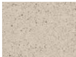
02 bianco luna