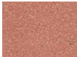
05 coccio pesto