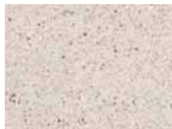
02 bianco luna